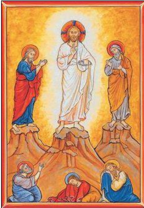
Mattheus 17: 1 - 13

8 maart 2020 zondag 'Reminiscere' ( 'Gedenk...' Psalm 25)